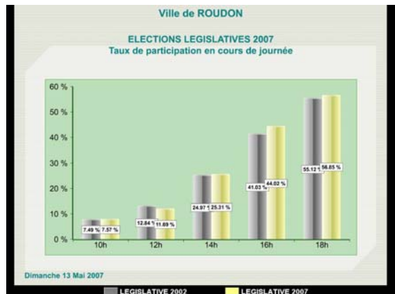
Taux de participation comparés