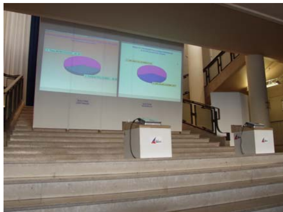
Projection sur grand écran ou TV Plasma