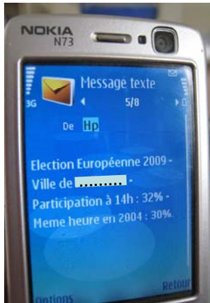
Taux de participation en cours de journée

Centralisation automatisée (par SMS) des taux de participation et des résultats « provisoires », des bureaux de vote vers le bureau centralisateur puis diffusion de ces résultats (par SMS).